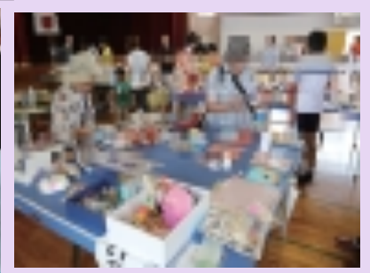
今年の 『河合ニコニコ王国フェスタ』の様子