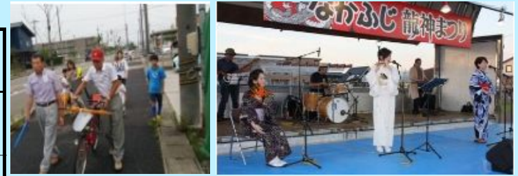
中藤島：安心安全ネットワーク と 龍神祭りの歌謡ショー