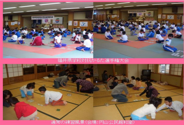
福井県学校対抗かるた選手権大会