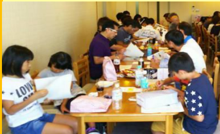
お子さんも 大人と一緒に地区の行事を学んでいきました。