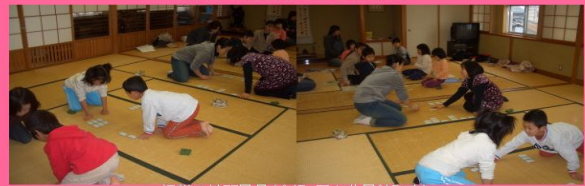
通常の練習風景(会場:円山公民館和室)