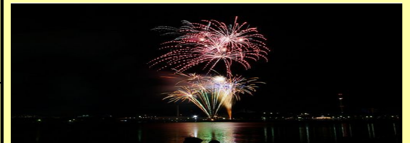
森田花火大会 : 花火が九頭龍川にもよく映えます