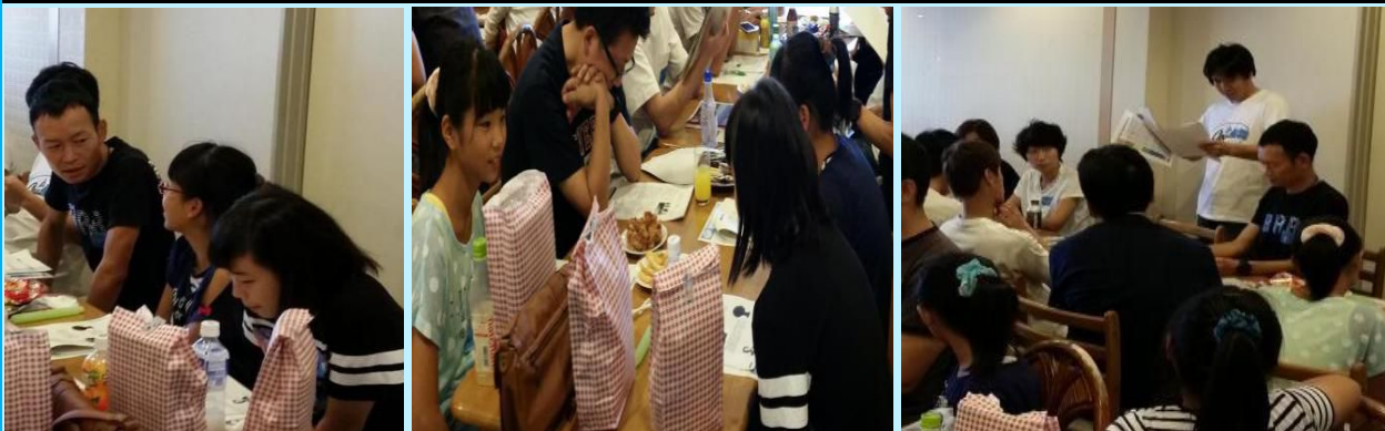
大人の人に教えてもらいながら、子ども達も意見交換して学んでいきました。