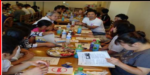
議長の進行をお子さんも一緒に聞いています。