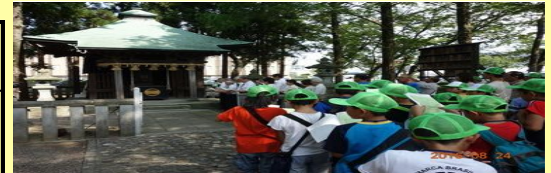
明新 : 交流行事で新田塚神社へ太田市小学生と共に参拝