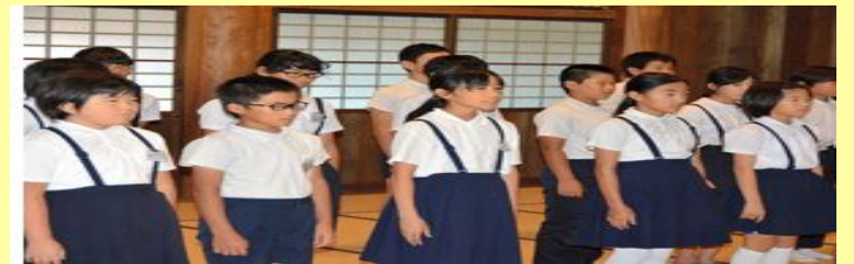
東藤島小6年生 : 岡倉天心への「誓いの言葉」を昌和