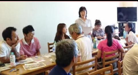
赤グループ : 発表の様子