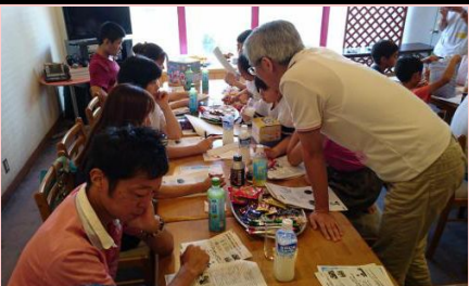
思わず身も乗り出しました。