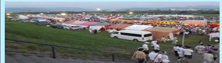
森田まつり：河川敷公園に多くの人たちが参加しています