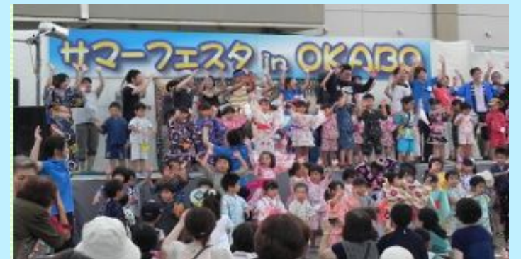
岡保：サマーフェスタ in OKABO