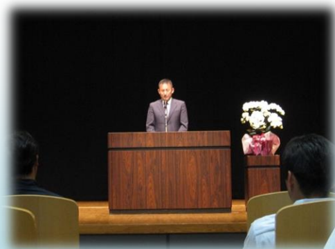
福井県PTA連合会 福井・永平寺ブロック長