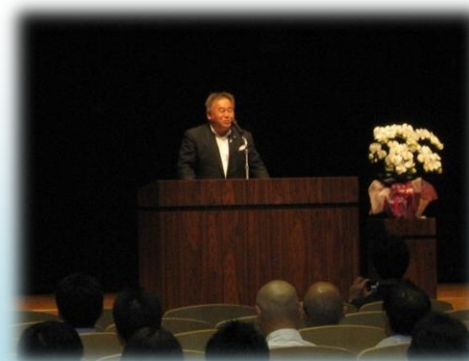
福井県私立幼稚園 PTA 連合会会長

6月21日（土）、福井県生活学習館（ユー・アイふくい）にて、今年度の地区別研修会が行われました。